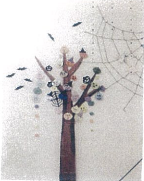
←「ココいこ」ハロウィン 完成!!!