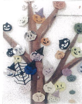
←見たことあるようなお顔もたくさん...