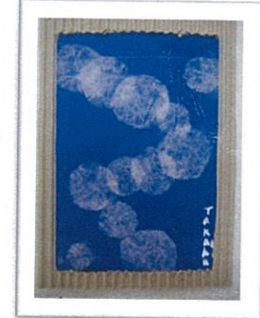
←海の中:キレイですね:♡