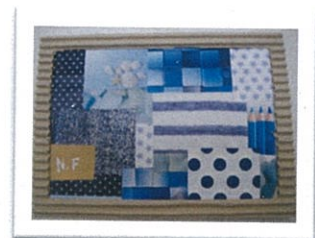
↑パランスよくカラーシユ!ステキです♪