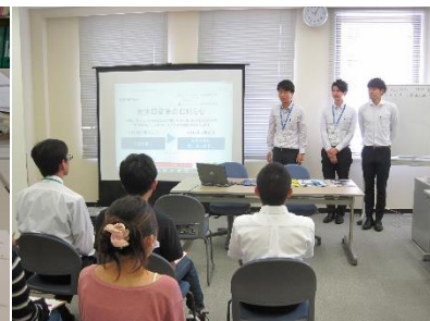
プログラム～車購入編