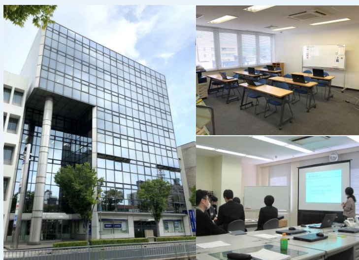
松江駅から徒歩2分