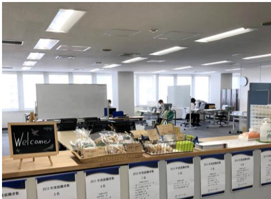
広いワンフロアで一面窓の明るいオフィス